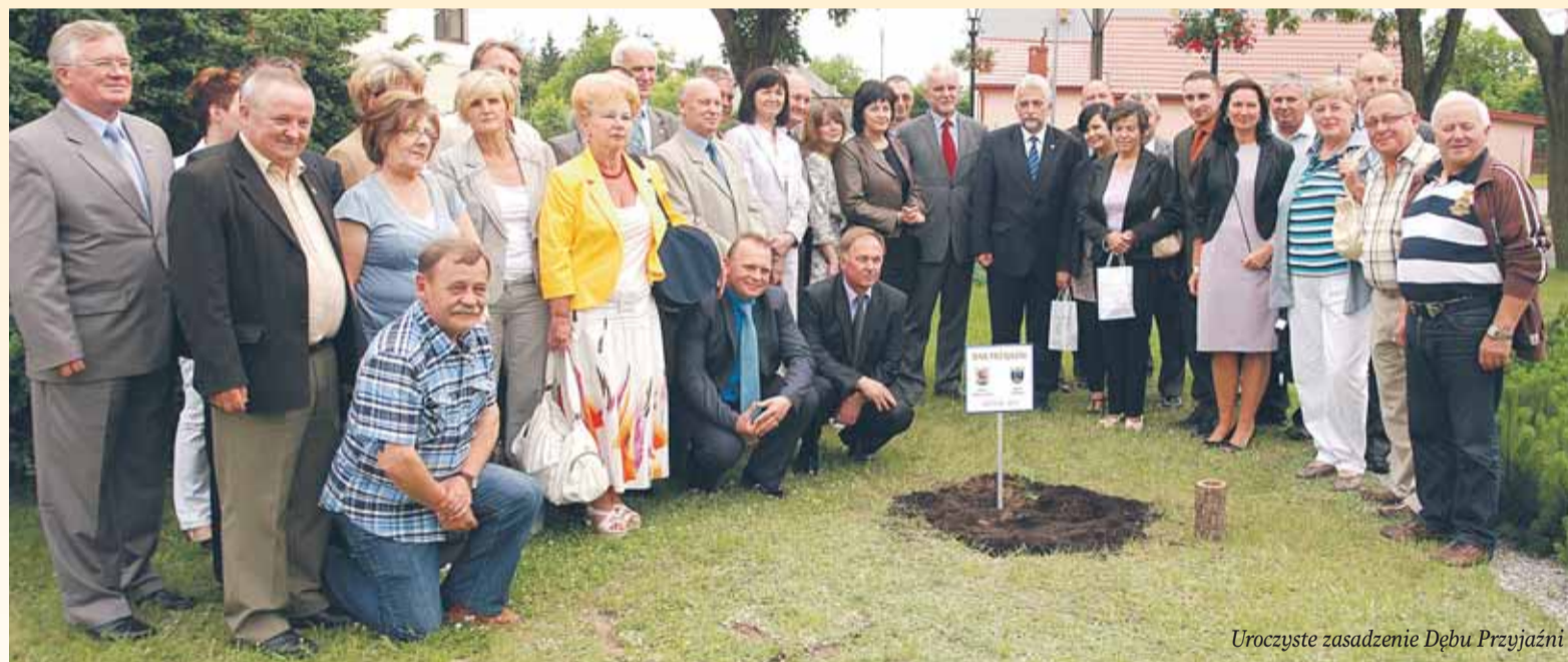
Uroczyste zasadzenie Dębu Przyjaźni

20 czerwca Gmina Nieporęt podpisała porozumienie w sprawie partnerskiej współpracy z Gminą Dobre Miasto. Po trzech partnerach zagranicznych, Gmina nawiązała współpracę z partnerem z Polski.